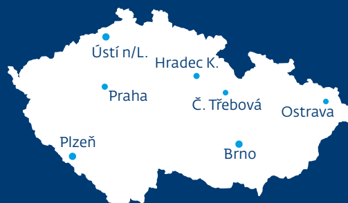
DVI, a.s. v roce 2022 zajišťovala svá školení prostřednictvím klasické formy výuky, distanční formy výuky a elektronické formy výuky.

Společnost DVI, a.s. zajišťovala v roce 2023 vzdělávání, povinná školení a kurzy, pro provozní zaměstnance ČD, a. s., ČD Cargo, a. s. a další společnosti působící v oblasti železniční dopravy. DVI, a.s. nabízí své služby prostřednictvím Centra technického vzdělávání v České Třebové a prostřednictvím šesti Regionálních center vzdělávání, která působí na celém území ČR – viz obrázek.